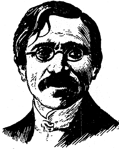
שלום-עליהם (שלום ראבינאוויטש)

געבוירן אין פערעיאסלאוו דעם 2 מערץ 1859, געשטארבן אין ניו-יארק דעם 13 מאי 1916.